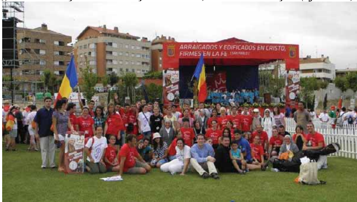
Pereleții Eparhiei de Oradea

„Inrădăcinați și întemeiați în Cristos, tari în credință” (cf. Col 2,7)