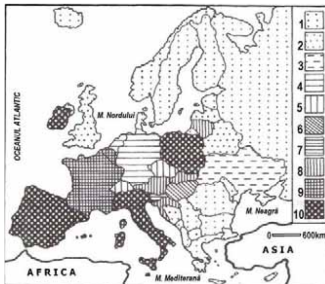
Fig. 2 – Răspândirea credincioșilor catolici în statele Europei: 1, sub 10%; 2, 10-20%; 3, 20-30%; 4, 30-40%; 5, 40-50%; 6, 50-60%; 7, 60-70%; 8, 70-80%; 9, 80-90%; 10, 90-100%

În țara noastră, potrivit studiului Considerații istorico-geodemografice asupra catolicismului din România în perioada 1930-2002 (în Sociologie românească , Vol. VII, nr. 2, 2009), populația catolică (peste 1.224.000 de credincioși – aproximativ 16% greco-catolici, circa 84% romano-catolici și 0,05 armeanocatolici) deține procente mai ridicate în județele din regiunile centrală și vestică: Harghita (65,5%), Covasna (36,2%), Satu Mare (26%), Bacău (17,1%), Neamț (12,6), Timiș (11,9%), Mureș (11,8%), Bihor (11,6%), Maramureș (11,6%) și Arad (11,2%) (Fig. 3).