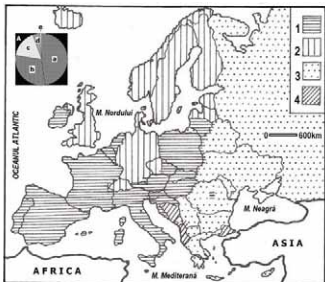
Fig. 1 – Răspândirea geografică a principalelor religii în Europa: 1, catolicism; 2, protestantism; 3, ortodoxism; 4, islamism. A. Structura confesională a Europei: a) catolici; b) protestanți; c) ortodocși (fără Federația Rusă); d) musulmani; e) alții.

Credincioșii catolici (aproximativ 35% din populația continentului) sunt concentrați, regional, în Europa Vestică, în Europa Sudică și în Europa Centrală (Fig. 1).