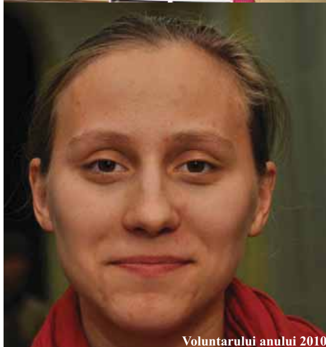
Voluntarului anului 2010