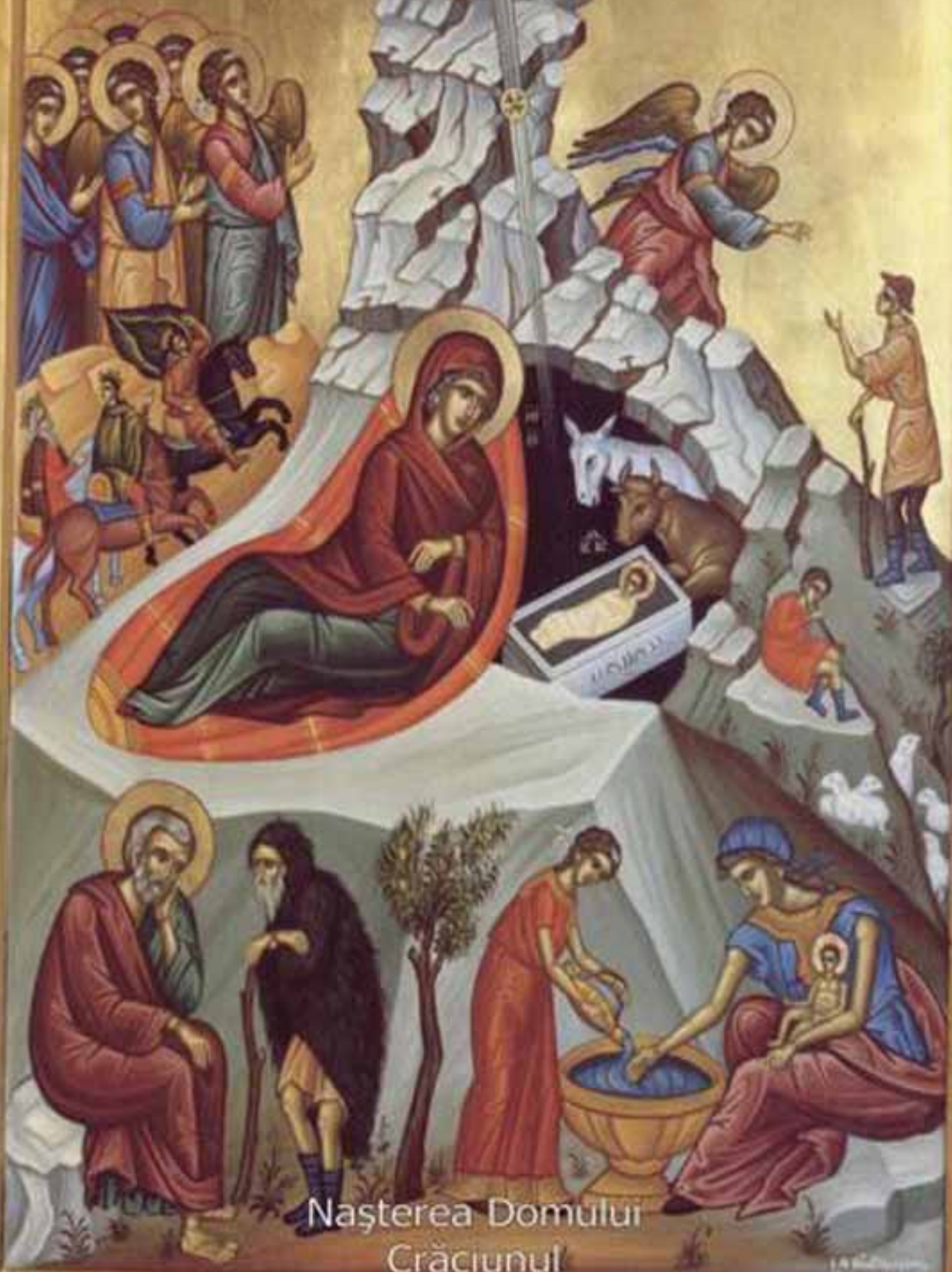
Nașterea Domului Crăciunul