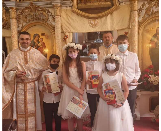
licvă și o icoană a Fericitului Valeriu Traian Frențiu.