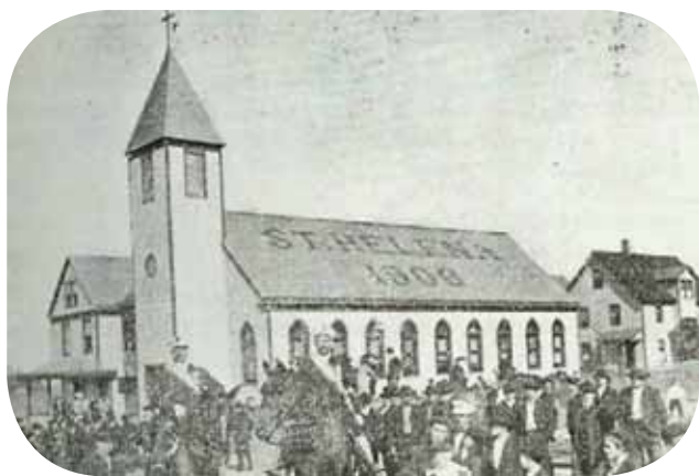
Aproape 1500 de români din Cleveland și împrejurimi participă la sfințirea bisericii greco-catolice Sf. Elena pe 21 octombrie 1906