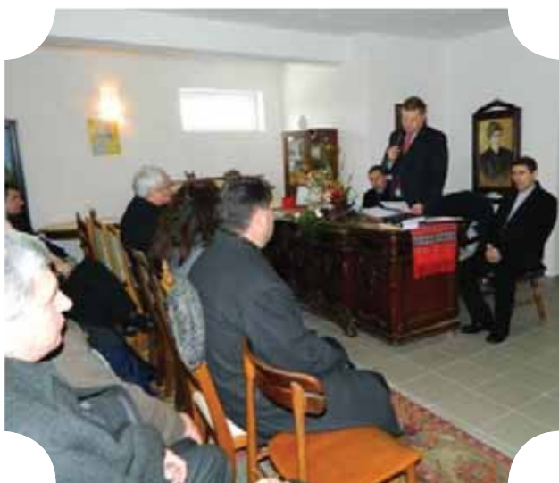
Muzeul de la subsolul bisericii greco-catolice din Bădăcin, dedicat „Sfinxului” Iuliu Maniu