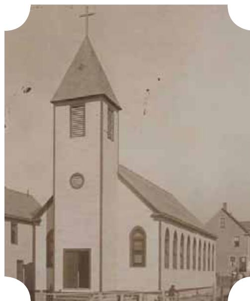
Biserica greco-catolică de lemn „Sf Elena”, Cleveland, 1910

Până în data de 27 mai 1906, când are loc aprobarea planurilor de construcție a bisericii și a casei parohiale, părintele Epaminonda Lucaciu se implică în redactarea unui ziar în limba română, numit „Românul”, acordă asistență spirituală românilor aflați în patru orașe: Aurora Illinois, (dieceza romano-catolică de Chicago), East Chicago, (dieceza romano-catolică Fort Wayne, Indiana), Mc Keesport, Pensylvania, (dieceza Pittsburghului) și