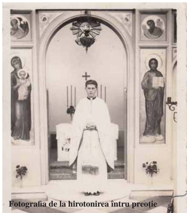
Fotografia de la hirotonirea într-o preoție

De cealaltă parte, chiar și instrumentele regimului comunist – informatorii și agenții Securității - l-au recunoscut pentru calitățile sale: „Trece printre gr[eco]cat[olici] drept cel mai bun preot. De fapt este o fire evlavioasă.” (5) „Ca și din celelalte scrisori și din această scrisoare reiese că [părintele] HIRȚEA este o personalitate înaltă, în care are speranță și încredere toți credincioșii și chiar și preoții.” (6) „Susnumitul din