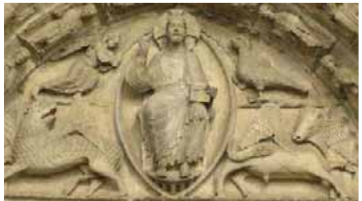
Catedrala din Chartres, fațada occidentală, timpanul central

Tatăl are fața ridată și este aproape orb, ochii lui fiind oboșiți de pânda întoarcerii improbabile a fiului care l-a părăsit. Statura sa este rotunjită, aproape ovală, amintind motivul “migdalei sacre” folosit de sculptorii medievali pentru a-L reprezenta pe Isus Cristos în timpanele portalelor de intrare.