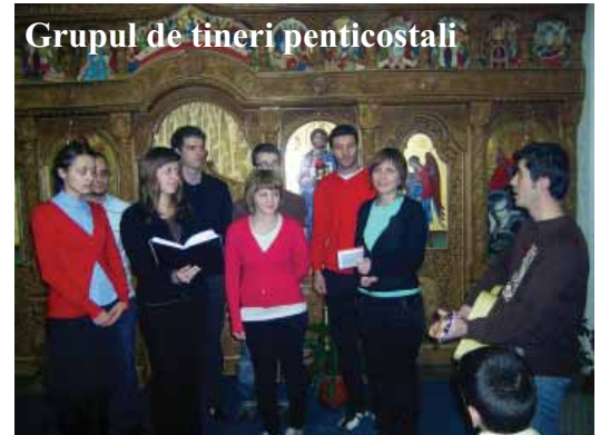
Grupul de tineri penticostali