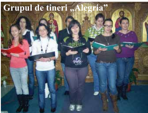
Grupul de tineri „Alegria”