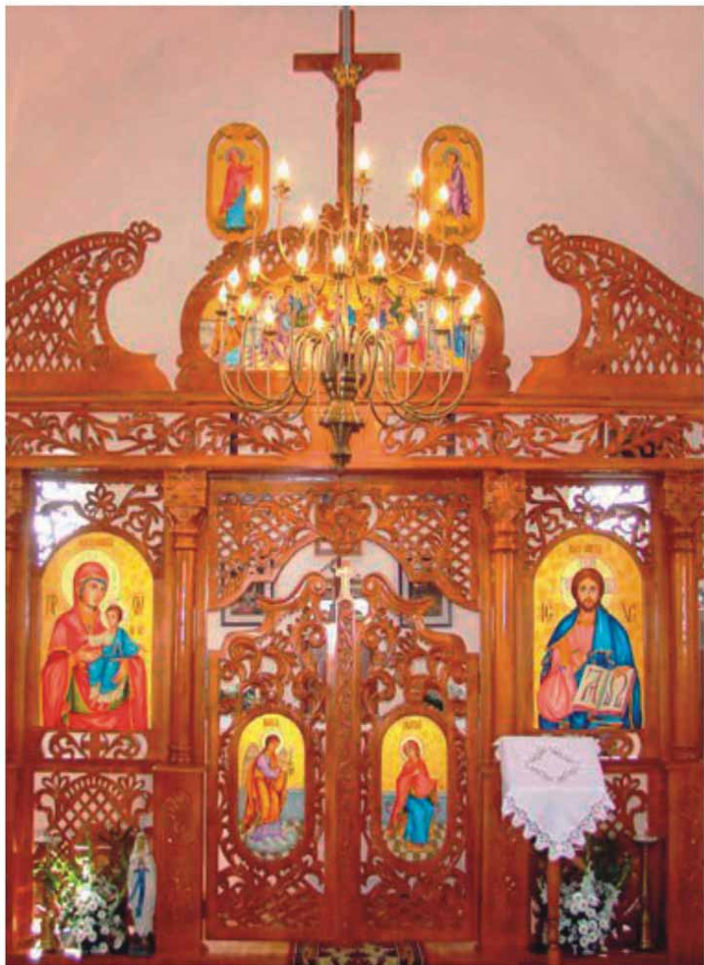
Iconostasul Bisericii din Cehei-Pușta, jud. Sălaj