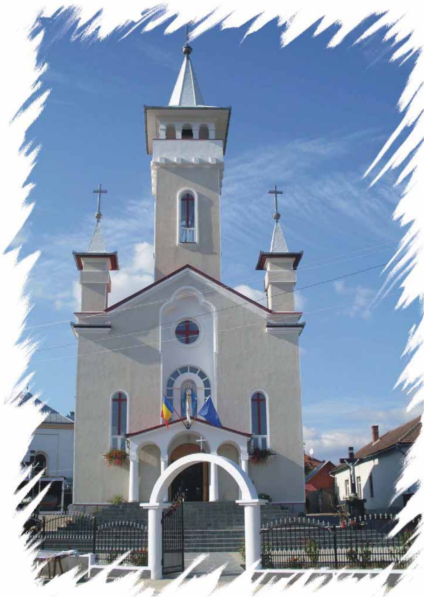
Biserica din Plopiș, județul Sălaj