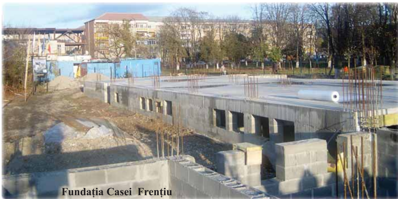
Fundația Casei Frențiu